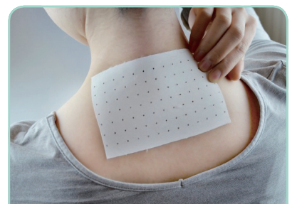
Pain relief Patch